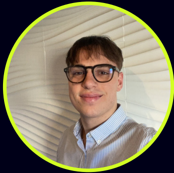
Hugo. H Digital Booster